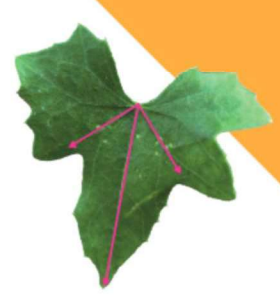
クロミノオキナワズズメウリ

※外来生物法に違反した場合、最高で個人の場合3年以下の懲役もしくは300万円以下の罰金、法人の場合1億円以下の罰金が科せられる場合があります。